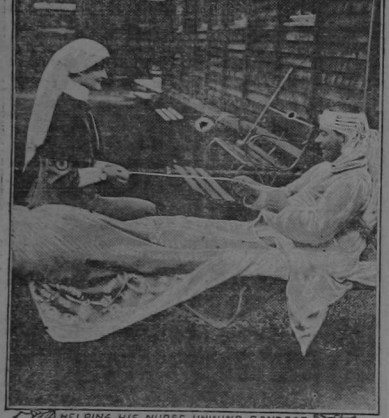
Helping his nurse unwind bandage. The accompanying photograph was taken in the third base hospital at Leeds, England. It shows an English officer in Europe abundant.

ENGLISH OFFICER ASSISTS NURSE WHO IS DRESSING BULLET WOUND.